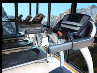
低酸素トレーニング (IHT)