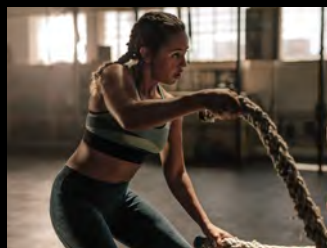
フリートレーニング