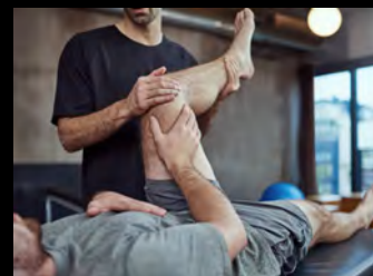
メディカルサポート