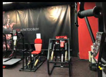
ウェイトトレーニング