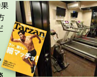
▲当ジム内 低酸素ルーム (ターザン2月号でも紹介されました)

★ ビジター利用もできます。まずは体験してみたい! という方も、お気軽にご相談ください。